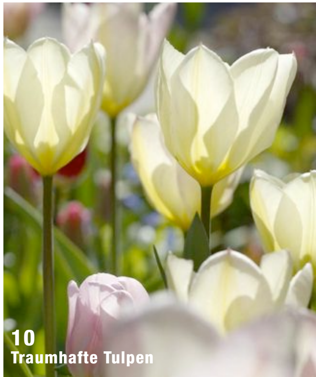
10 Traumhafte Tulpen