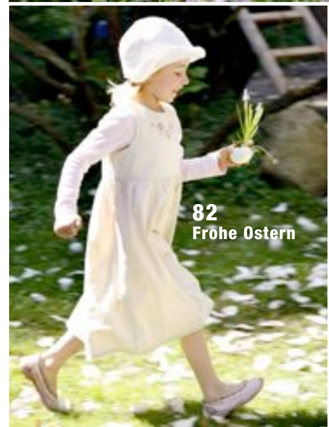
82 Frohe Ostern