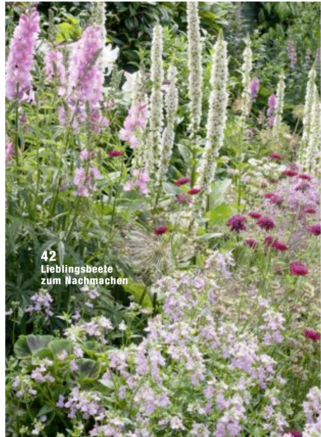
42 Lieblingsbeete zum Nachmachen