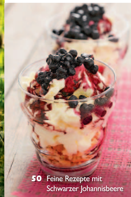
50 Feine Rezepte mit Schwarzer Johannisbeere