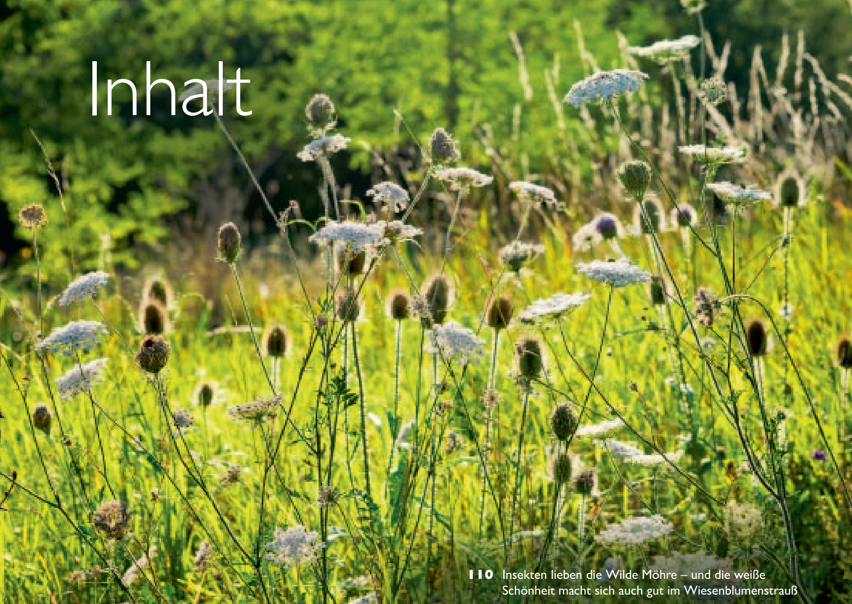
110 Insekten lieben die Wilde Möhre – und die weiße Schönheit macht sich auch gut im Wiesenblumenstrauß