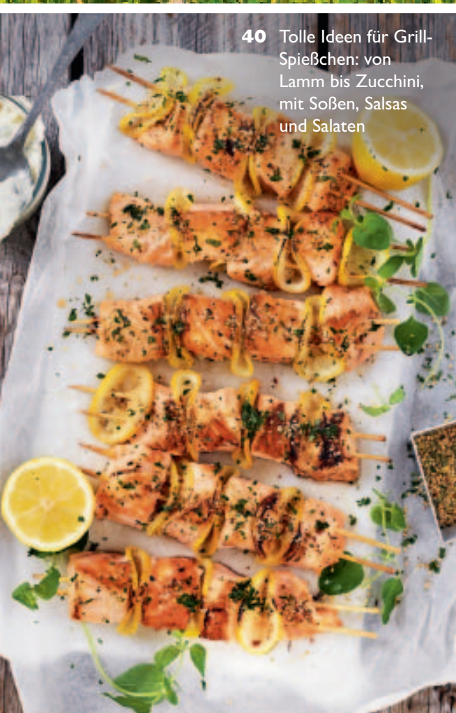
40 Tolle Ideen für Grill-Spießchen: von Lamm bis Zucchini, mit Soßen, Salsas und Salaten