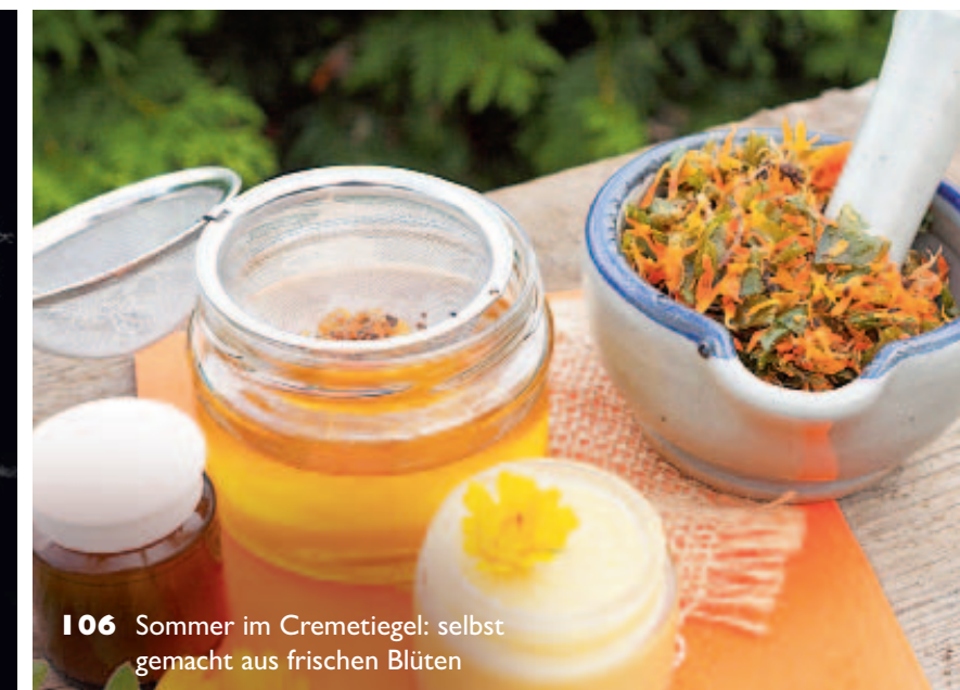
106 Sommer im Cremetiegel: selbst gemacht aus frischen Blüten