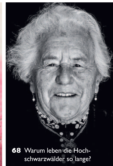
68 Warum leben die Hochschwarzwälder so lange?