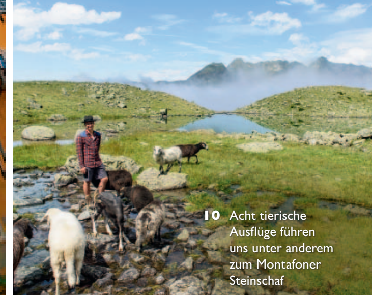
10 Acht tierische Ausflüge führen uns unter anderem zum Montafoner Steinschaf